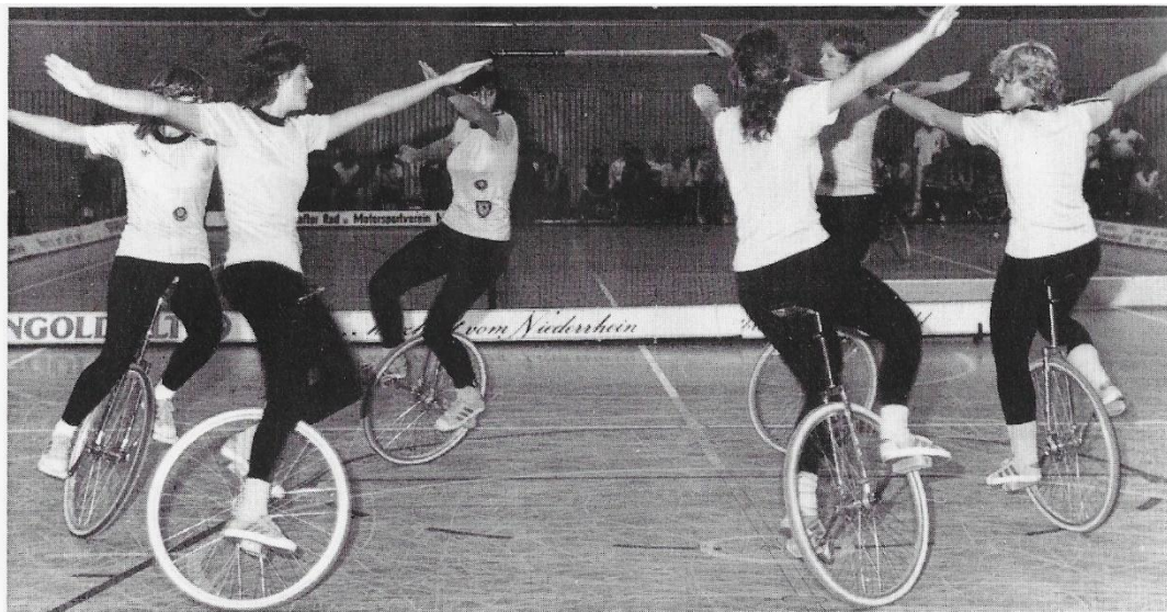
Vielfacher Deutscher Meister 6er Einrad Herzogenaurach