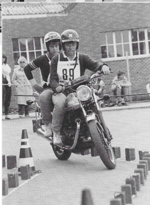
2-Mann-Sozius-Sonderklasse immer beliebter